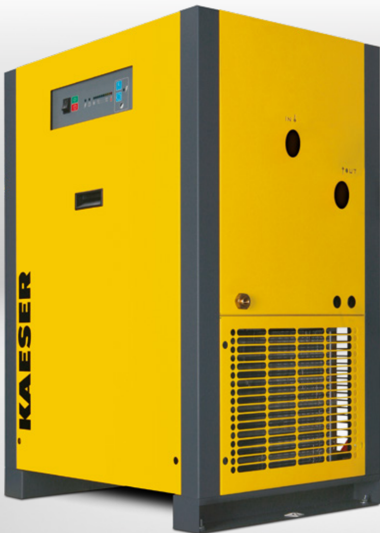
Versión básica THP 40-50