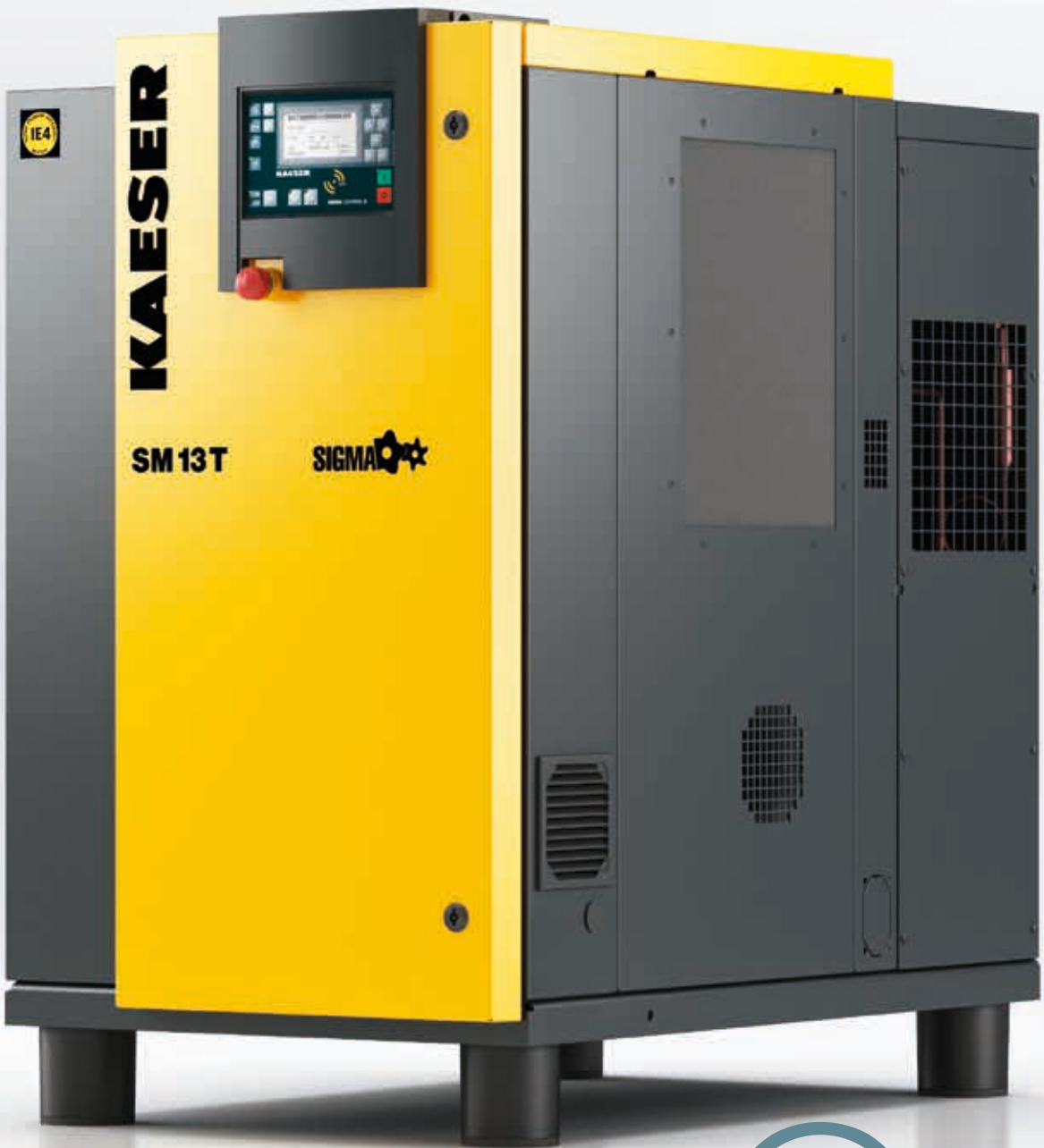
Imagen: SM 13 T

Todos los trabajos de mantenimiento pueden llevarse a cabo desde la misma parte lateral. Para ello, el panel izquierdo de la cabina es desmontable, y desde allí es sencillo acceder a todos los puntos de mantenimiento del equipo.