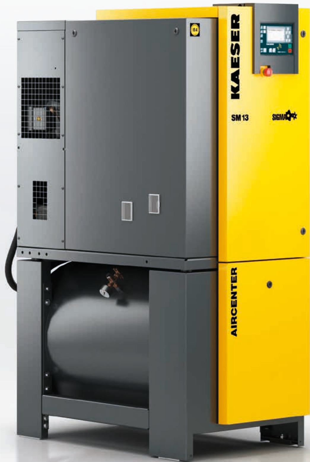
Imagen: AIRCENTER 13