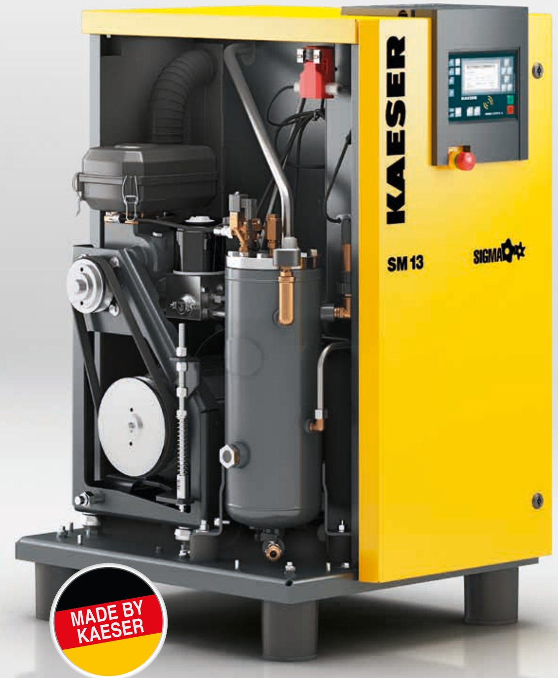
Imagen: SM 13

Hasta 96% aprovechable en forma de calor