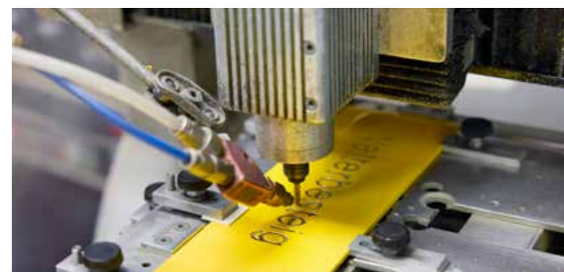
El aire comprimido se utiliza en casi todos los puestos de trabajo de producción: grabado láser de cuchillos de mesa, fabricación de cables, corte de mangueras, grabado (técnica publicitaria).

Los intercambiadores de calor de placas instalados en los compresores permitieron utilizar el principio de la recuperación del calor. De este modo, se puede recuperar hasta el 96 % de la potencia eléctrica consumida en forma de calor, que en GW St. Pölten se pone a disposición del sistema de calefacción a través del acumulador tampón.