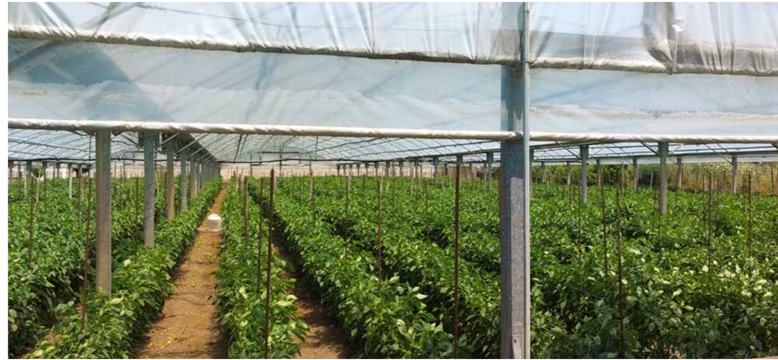
Cultivo de tomates cerca de la empresa.

Pasquale Russo nos explica las ventajas: «Los sopladores de tornillo FBS de KAESER cuentan con motores de eficiencia ultra