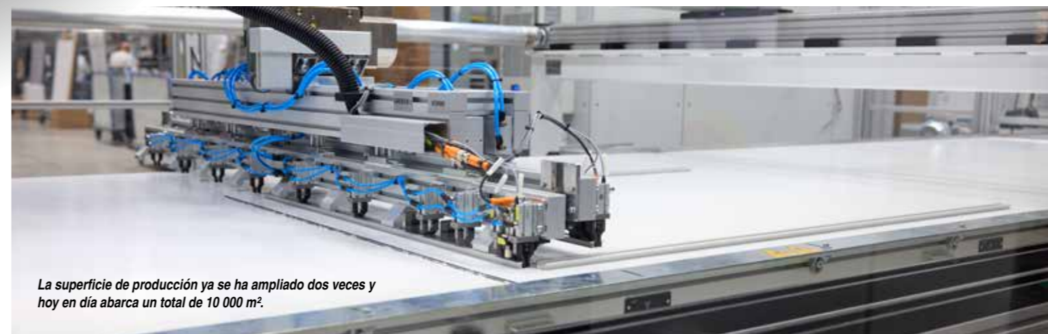
La superficie de producción ya se ha ampliado dos veces y hoy en día abarca un total de 10 000 m 2 .