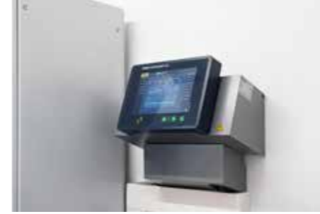
Foto superior: El SIGMA AIR MANAGER 4.0 funciona en perfecta armonía con el sistema de control de la planta.

Este requisito se cumple de manera óptima con la nueva y avanzada estación de sopladores, con un total de 300 kW, que consta de dos grandes sopladores de tornillo con control de frecuencia de la serie GBS 1050 L SFC, con 90 kW, y tres sopladores de tornillo más pequeños con control de frecuen-