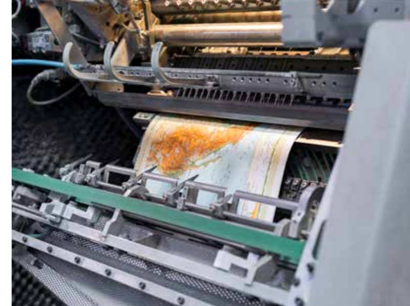
La editorial Westermann es conocida entre jóvenes y mayores por el atlas mundial Diercke, que se imprime en su sede de Brunswick.