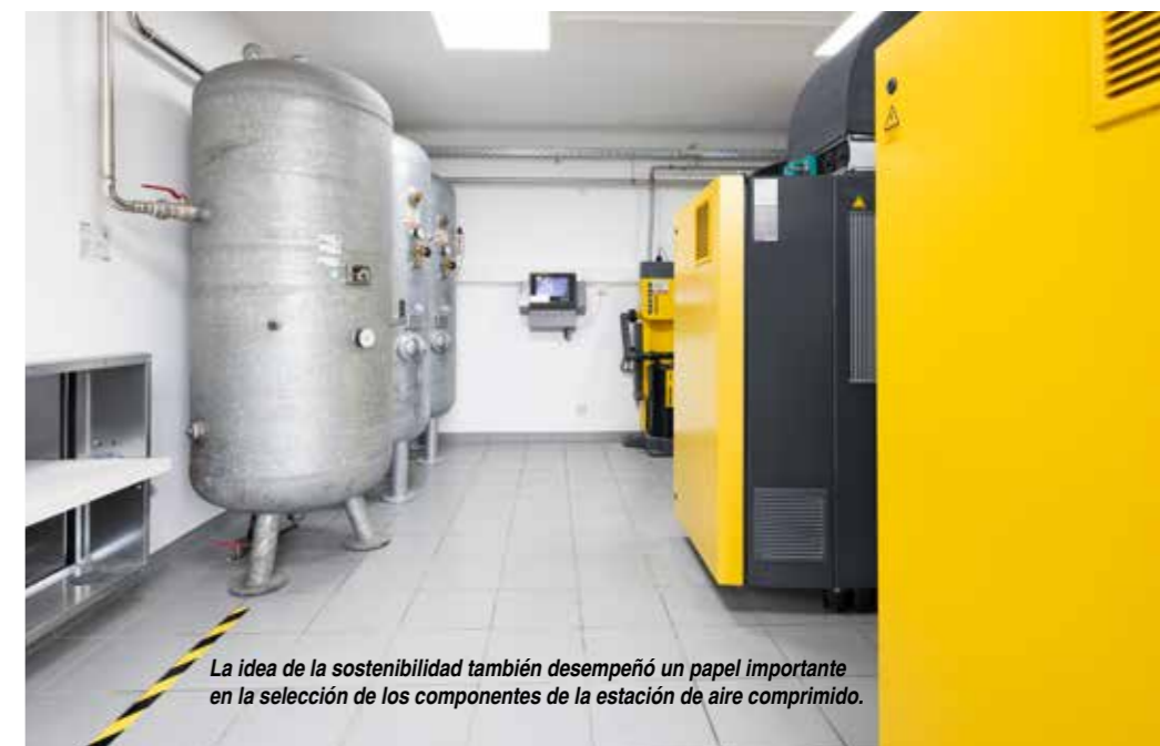
La idea de la sostenibilidad también desempeñó un papel importante en la selección de los componentes de la estación de aire comprimido.

Verena Gorny, responsable de sostenibilidad