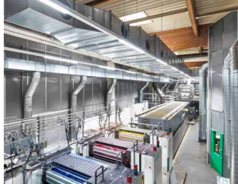
El aire comprimido es una de las fuentes de energía más importantes para el funcionamiento de las modernas máquinas de impresión y acabado.

Al recorrer la imprenta de la sede central, se aprecia que el aire comprimido desempeña aquí un papel muy importante. Es una de las fuentes de energía más importantes para el funcionamiento de las modernas máquinas de impresión y acabado. Su función principal consiste en controlar una gran variedad de procesos neumáticos. Por ejemplo, en el transporte de papel, para transportar con precisión las hojas individuales a través de la máquina. Aspiradoras y boquillas de soplado especiales separan las hojas entre sí, las levantan y las guían con precisión hacia los grupos de impresión. Muchos elementos mecánicos de la máquina de impresión, como cilindros, válvulas y rodillos, se controlan neumáticamente. Además, el aire comprimido se utiliza para eliminar el polvo y las fibras de papel. «Sin aire comprimido no se puede imprimir ningún libro», explica Martin Lauke, director de ingeniería de operaciones, «por lo que es importante que el aire comprimido esté disponible de forma confiable».