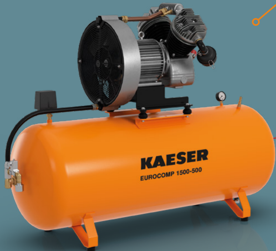
Fig. EPC 1500-500