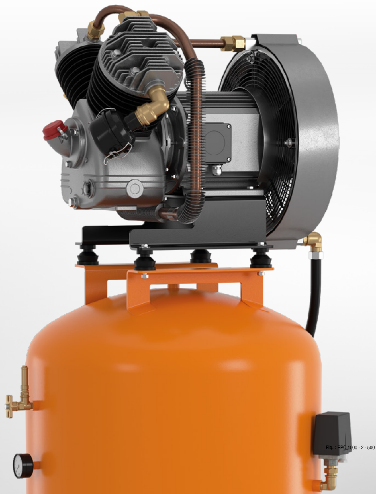
Fig. : EPC 1000 - 2 - 500