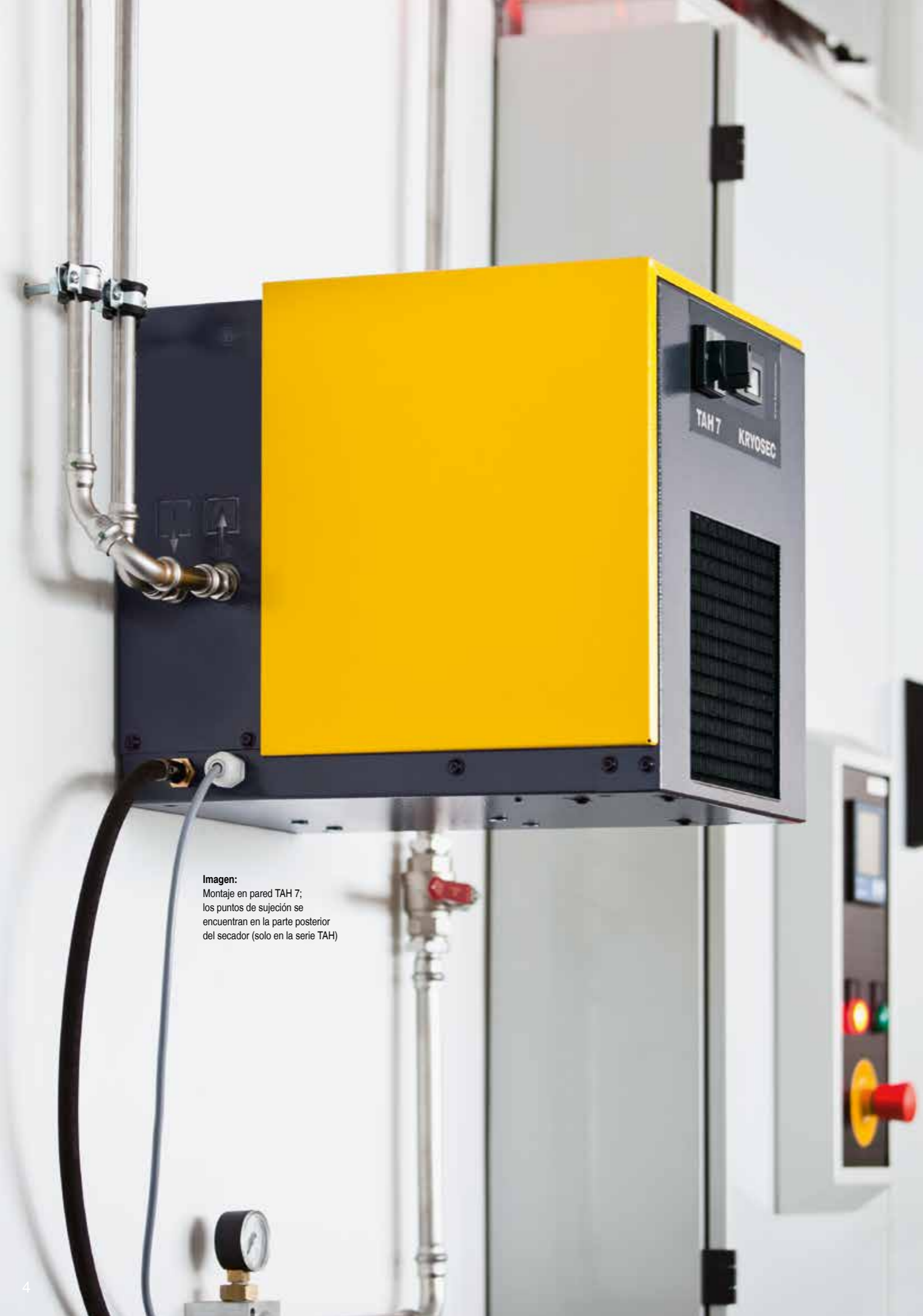
Imagen: Montaje en pared TAH 7; los puntos de sujeción se encuentran en la parte posterior del secador (solo en la serie TAH)