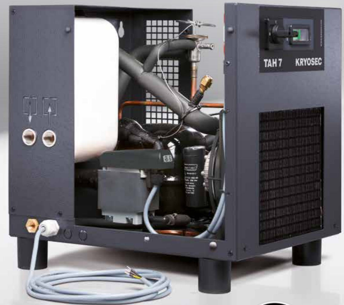
Imagen: TAH 7