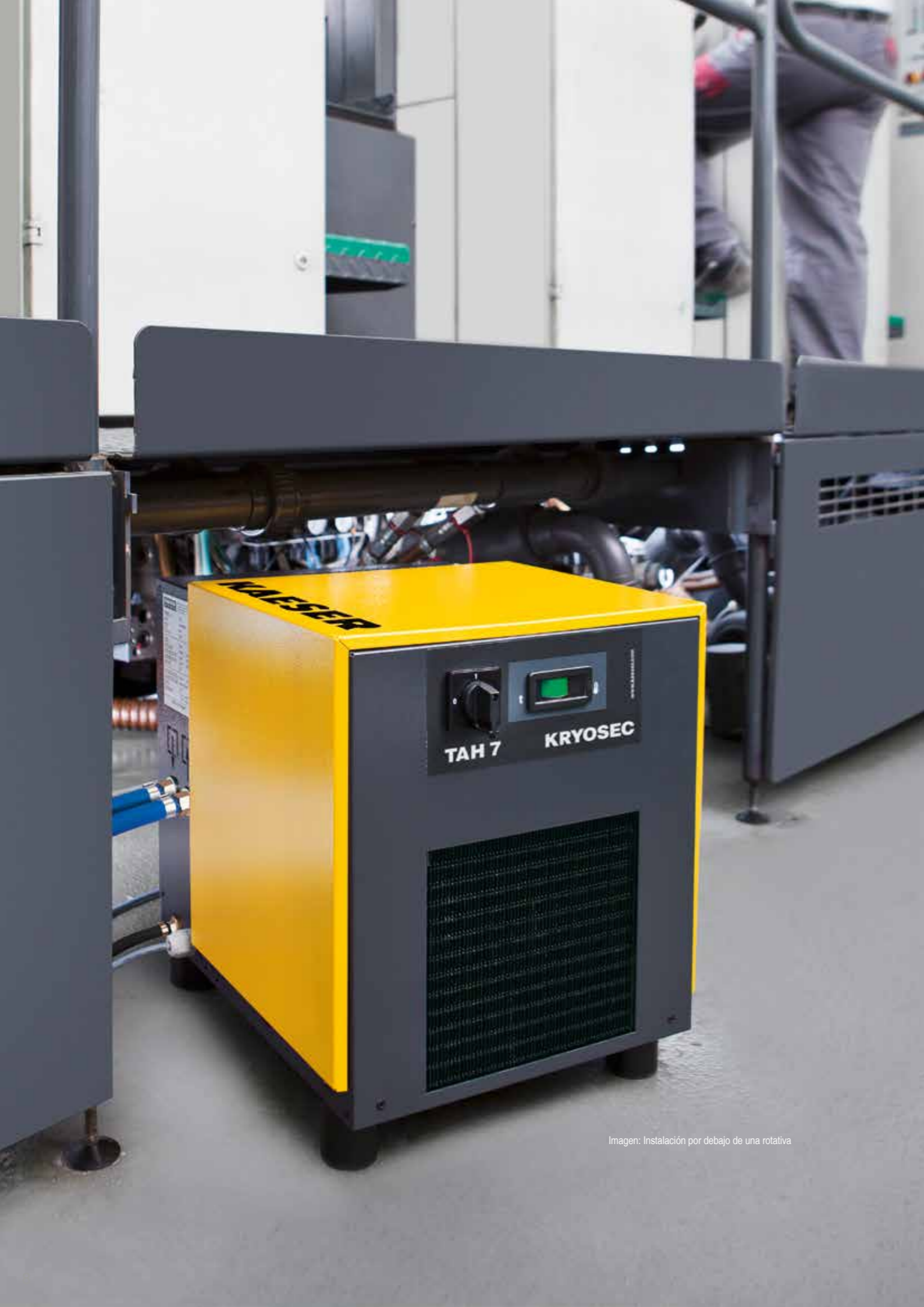
Imagen: Instalación por debajo de una rotativa