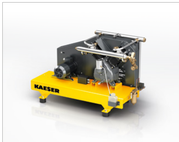
Fig. : N 153-G