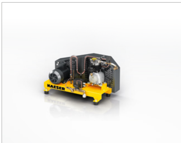
Fig. : N 60-G